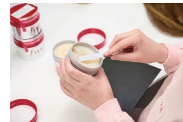
在严格的安全和卫生标准下生产

我们将尊重人权和实现 DE&I (多元化、公平和包容性) 视作推动全球业务的重要主题。在推动对员工的人权教育的同时，通过录用和启用不同背景的多样化人才来促进本集团和社会的可持续发展。此外，还逐步推进供应链中的人权尽职调查。承担生产职能的 Fine Today Industries Co., Ltd. 已获得化妆品生产质量和安全相关国际标准 (ISO22716) 认证，并在此基础上遵守规范的生产标准，努力制造高品质和安全的產品。Shiseido Vietnam Inc. 已获得“清真认证”，也生产获得清真认证的产品。未来，并将促进提供根据 APAC 各地区的需求和气候精心定制的本地化产品。各个国家和地区的网点自愿为地区社会做出贡献，并加强与各利益相关方的沟通。