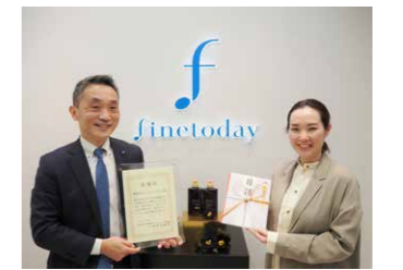
向地方政府和社会福利机构等捐赠产品