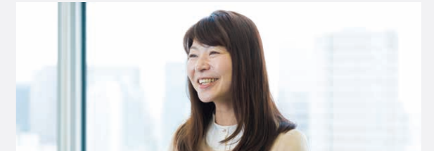
FineToday Co., Ltd. 人事本部 Employee Success G Group Manager YN

-请谈一谈人事本部下属的 Employee Success Group 的职责。