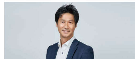
Fine Today Korea Co., Ltd. General Manager YS

Big Venture 这一词很适合形容 FineToday 集团的魅力。我们已经拥有许许多多备受广大客户喜爱的 Big Brand，我们能够像 Venture 企业一样，无所畏惧，勇往展开新的挑战。我们将无比珍惜我们所培育形成的美意识，向人类和环境传播永久的美丽，让生活更加丰富多彩。这一充满热情的理念，在各个领域都得到了生动体现。我坚信，这些令人惊叹的优质资产和前沿精神，是 FineToday 集团发展壮大的原动力！