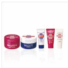
ハンド・薬用シリーズ