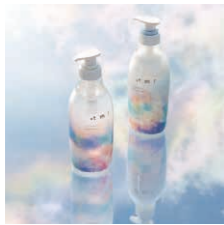
t m r