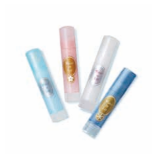
ウォーターリップ