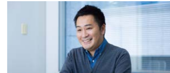
株式会社ファイントゥデイ SC 購買統括本部 国内 SCM G グループマネージャー YKさん

いちからみんなでつくり上げるというフェーズにワクワクし、迷わず資生堂からの転籍を決めました。異業種からの転職者も多く、さまざまな考え方や知識に触れることができ面白いです。それぞれに得意領域を持ち、判断のベースになる価値基準が違うので意見やアイデアに刺激を受けることも多いです。風通しが良く議論が活発で、積極的に自ら手を挙げ、周りもその挑戦を応援してくれます。会社とともに自分が成長していくプロセスを楽しめる企業風土がファイントゥデイグループの魅力の一つだと思います。