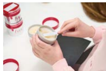
厳しい安全・衛生基準による生産

グローバルに事業を推進する上で、人権の尊重や、DE&I (多様性、公平性、包摂性) の実現は重要なテーマと捉えています。従業員に対する人権教育を推進するとともに、バックグラウンドに関わらず多様な人財を採用ならびに登用することで、当社グループと社会の持続的な発展につなげていきます。また、サプライチェーンにおける人権デュー・ディリジェンスも段階的に進めています。生産機能を担うファイントゥデイインダストリーズでは、化粧品製造の品質・安全性に関する国際規格 (ISO22716) を取得し、それに基づく適正な製造基準を順守し、高品質で安全なものづくりに努めています。FT Industries Vietnamは「ハラール認証」を取得しており、同認証を受けた製品も製造しています。APAC各地域のニーズや風土等にきめ細かく対応し、ローカライズした製品の提供なども推進しています。地域社会に対しては、各国・地域の拠点が自発的に貢献活動に取り組むなど、さまざまなステークホルダーとのコミュニケーションを強化しています。