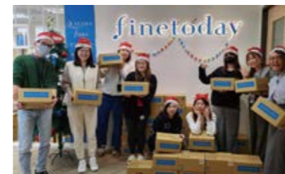
子どもたちに笑顔を届けるギフトボックスプロジェクト (Fine Today Taiwan Inc.)