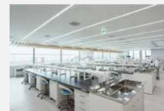
研究開発 (ファイントウデイビューティーイノベーションセンター: 江東区豊洲) 本社、工場へも好アクセスという都市型ラボの特性を活かし、各拠点が緊密に連携した製品開発を実施