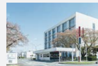
生産 (ファイントウデイインダストリーズ: 埼玉県久喜市、FT Industries Vietnam: ベトナム) 前身の資生堂時代から一貫して、美意識を礎とした高品質なパーソナルケア製品の生産を担う