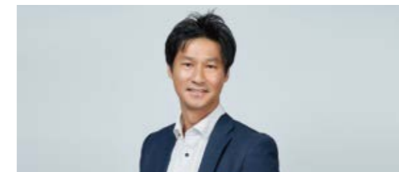
Fine Today Korea Co., Ltd. General Manager YSさん

ファイントゥデイグループの魅力を表す言葉は Big Venture だと思います。多くの顧客から愛されるBig Brandを我々はすでにたくさん持っており、Venture 企業のように恐れず新しいチャレンジができます。我々が培ってきた美意識を大切にしながら、人々にも、環境にも、ずっと続く美しさと豊かさを届けていく。そんな熱い想いが、リージョンを超えて体現されていると感じています。こういった我々の素晴らしい資産とフロンティア精神がファイントゥデイグループの成長の原動力になっていると私は信じています。