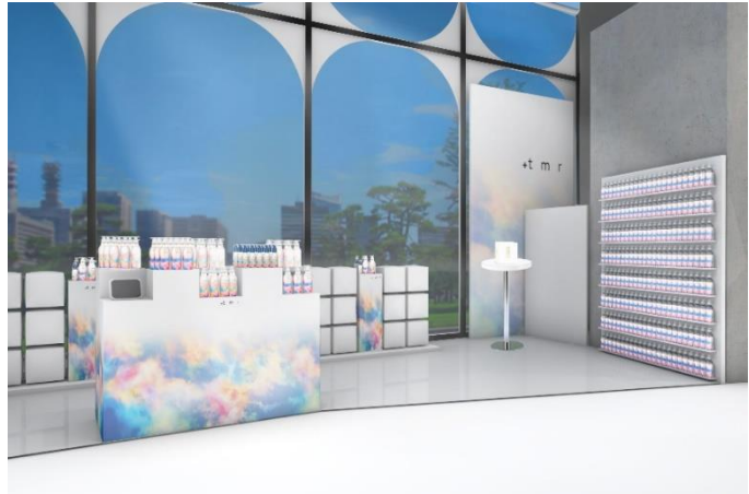
【1F POPUP ブース右手】