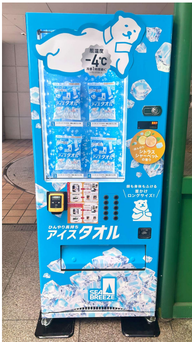
専用自販機（ハンズ渋谷店）

自販機という販売形態を活用することで、お客さまが必要なタイミングで手軽に購入できる機会を提供し、快適な夏の外出やレジャー活動をサポートしてまいります。