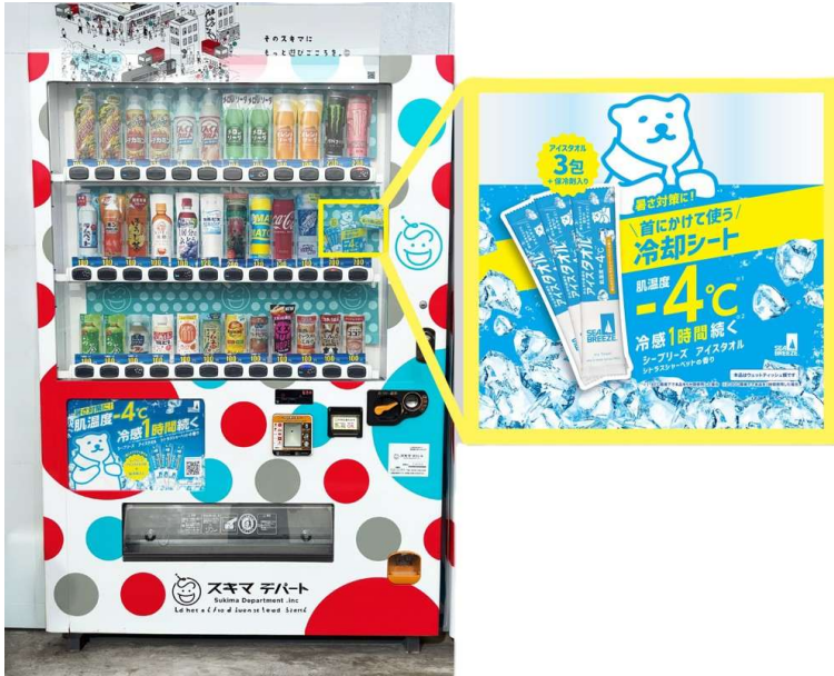
飲料自販機での販売の様子

飲料自販機という広く普及したインフラを活用することで、通勤・通学時、屋外イベント会場、公園、観光地など、日常の生活動線上で「お客さまが暑さを感じたその場で購入し、その場で使える」という新たな購買体験を実現します。