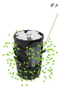
<ダメージ部位を感じ>