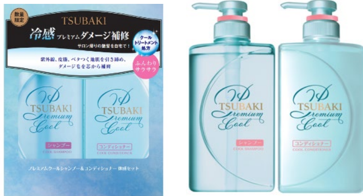
【TSUBAKI プレミアム クールシャンプー&amp;コンディショナーセット】